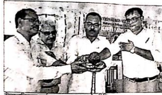
दोषाप्रमोदित कर कार्यक्रम का उद्घाटन करती अतिथि.