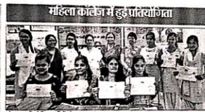
पोस्टर प्रतियोगिता की विजेता छात्र.