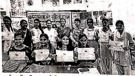
कार्यक्रम में शामिल प्राचार्य, शिक्षक व छात्राएं।